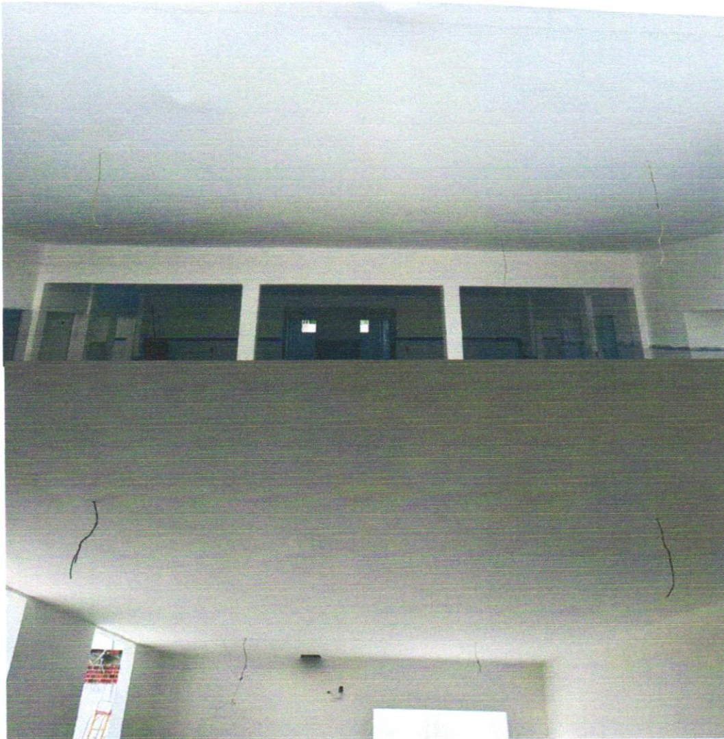
3) EXECUÇÃO ESTRUTURA DA MINI QUADRA